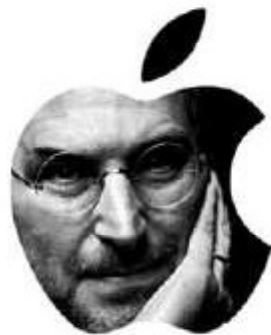
Steve Jobs 1955 - 2011